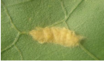
तंबाखुची पाने खाणारी अळीचे अंडी अवस्था