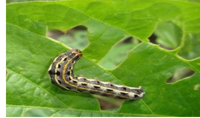
तंबाखुची पाने खाणारी अळी